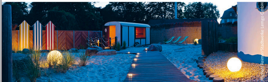
Michael Reimer/Stadtwerke Lemgo GmbH