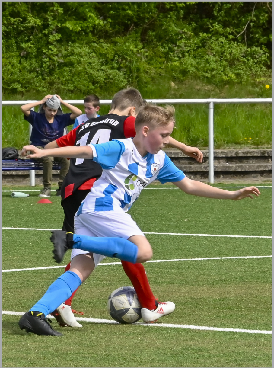
Stürmer Julian zeigt hier unheimlich viel Dynamik in seiner Aktion. Stark!