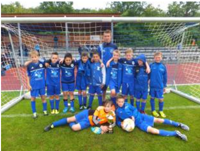
Schloss Cup bleibt „dahoim“

Die 8 Mannschaften spielten den Schloss Cup auf zwei Plätzen nach dem Modus jeder gegen jeden aus. Dabei ging der SC Bad Salzuflen mit 3, der VfL Hiddesen und der TuS Brake mit jeweils zwei Teams an den Start. Komplettiert wurde das Starterfeld mit dem Team des VfL Bückeburg, der nur durch Zufall im Lipperland landete (Verwechslung mit Bielefeld), aber sein Kommen nicht bereuen sollte. Nach 28 Spielen führte der TuS Brake I die Abschlusstabelle mit 19 von 21 möglichen Punkten an. Danach folgte der VfL Hiddesen mit 18 Punkten, der nur gegen den Schloss Cup Sieger aus Brake knapp mit 1:0 verlor. Den dritten Platz belegte die sehr spielstarke Mannschaft aus Niedersachsen, die sich erst an die veränderten Regeln in NRW, wie z.B. kein Abseits, kein Rückpass etc., gewöhnen musste.