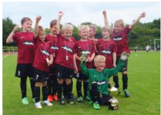
Viele lachende Gesichter bei der Tura

Unsere jüngsten Kicker traten mit zwei Teams an und hatten die Minikicker der JSG Klüt/Wahmbeck, des TuS Brakelsiek, des TBV Lemgo und von Tura Löhne zu Gast. Das Turnier nach dem Modus jeder gegen jeden endete mit 6 siegreichen Teams. Den Fairplaypokal erhielt das weitangereiste Team von Tura Löhne. Die vielen Eltern, Großeltern und Freunde waren von den tollen Leistungen der Minikicker begeistert.