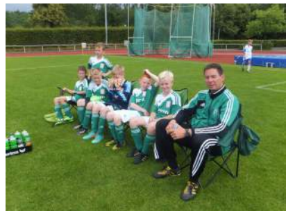
VfL Bückeburg hat es sich gemütlich gemacht