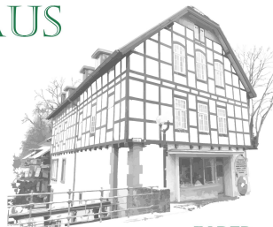
IN DER LANGENBRÜCKER MÜHLE

eine behutsame Auseinandersetzung mit der Endlichkeit aller Dinge.