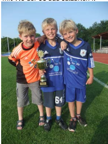
Schloss Cup bleibt in Brake

Im kleinen Finale wurde gleichzeitig die Stadtmeisterschaft von Bad Salzuflen ausgespielt. Stadtmeister wurde nach einem sehr spannenden 8 - Meter Schießen mit 9:8 der SC Bad Salzuflen I.