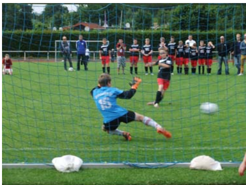
9 Meter Krimi

Das Endspiel zwischen dem Blomberger SV und der JSG Fußball Lemgo musste ebenfalls durch ein 9 - Meter Schießen entschieden werden und bildete somit einen spannenden Abschluss dieses tollen Fußballwochenendes. Die Blomberger erwiesen sich als nerven stärker und freuten sich ausgelassen über den Schloss Cup 2013.