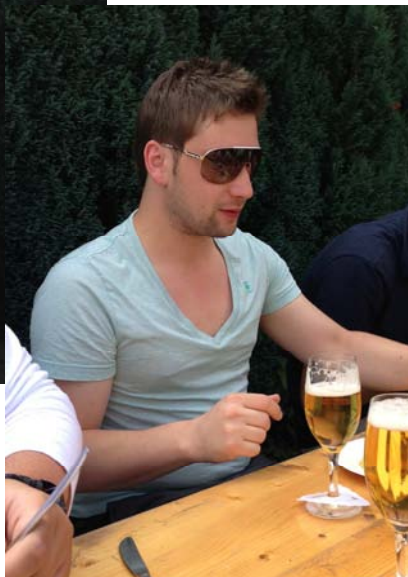
Rechts: wer das Brusthaar findet, kann zwei VIP-Karten für das Heimspiel gegen Yunus Lemgo gewinnen.