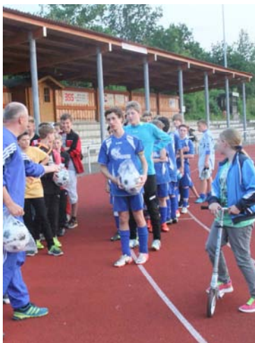
Siegerehrung C Junioren

Nachdem der Titelverteidiger SC Verl dem Turnier fernblieb, spielten 11 Teams parallel in zwei Gruppen um den Schloss Cup 2013. In der Gruppe A gewann das Team des Gastgebers