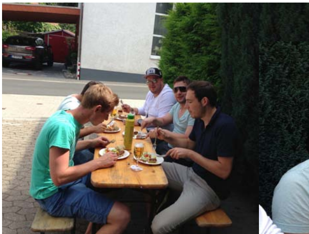
Auch eine Delegation der ersten Mannschaft bereitet sich im Elfmeter auf den Bundesligastart vor (oben).