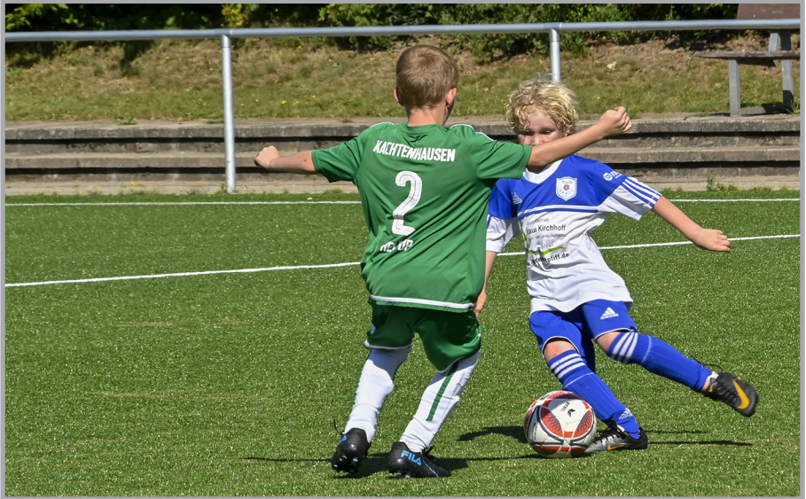
Johna geht mit einer geschickten Körpertäuschung an seinem Gegner aus Asemissen vorbei. Das untere Foto, wie alle aufgenommen von Matthias Bödeker, zeigt den weiteren Verlauf der Aktion...