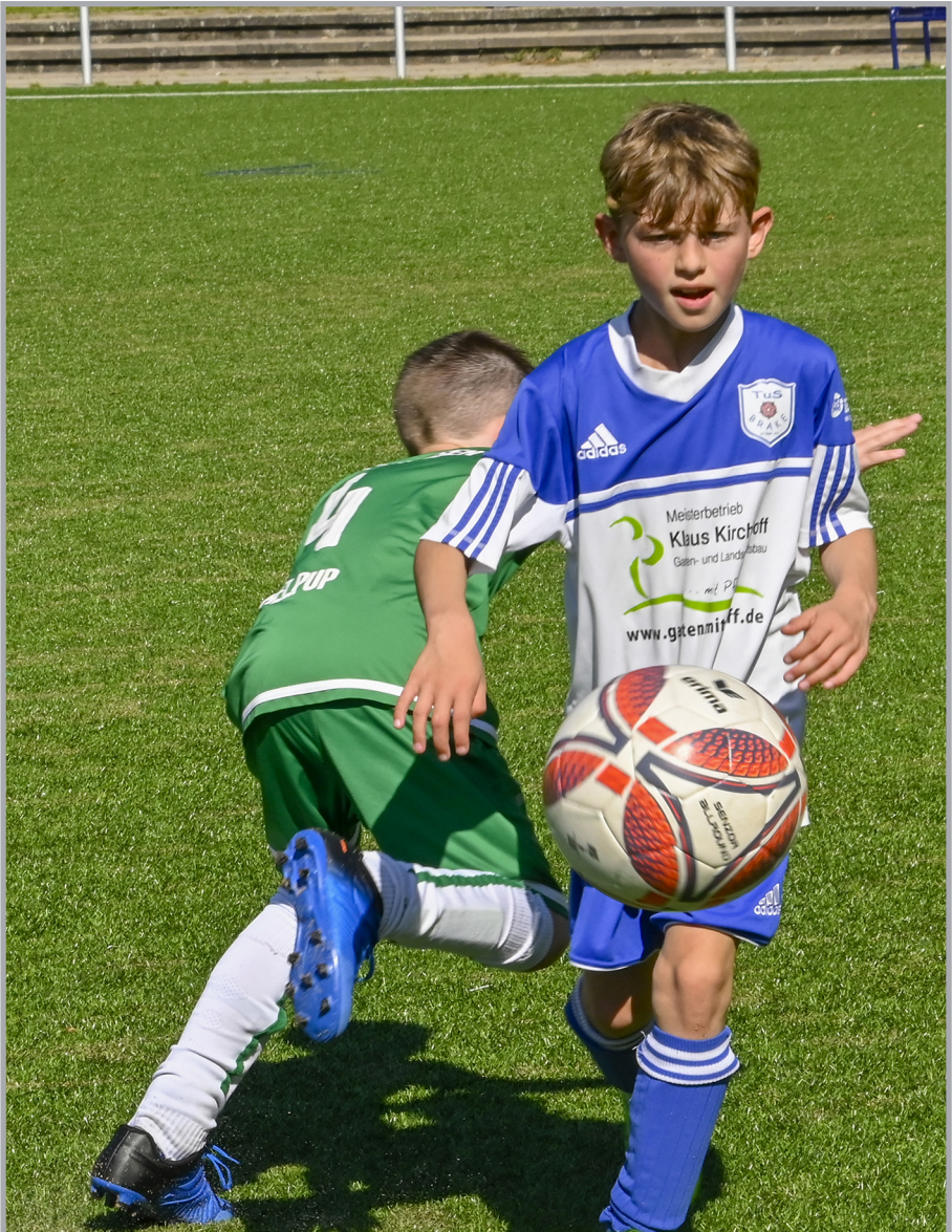
Felix verliert niemals den Ball aus den Augen und zeigt in jeder Spielsituation eine hervorragende Übersicht.