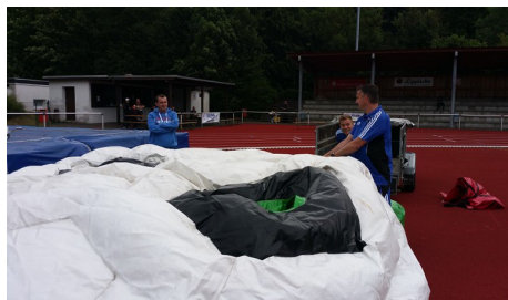
Aufbau der Hüpfburg