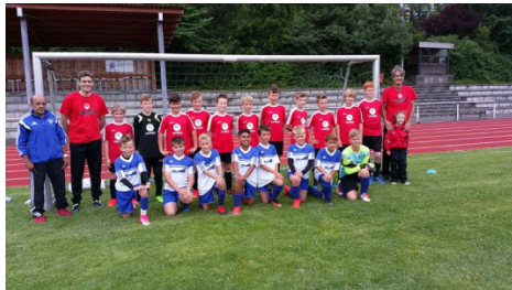
E Jugend: TuS Bexterhagen (rot) und SC Bad Salzuflen

Das ebenfalls für den 24.06.2017 angesetzte Endspiel der B – Juniorinnen wurde aufgrund der anstehenden Aufstiegsrunde verlegt.