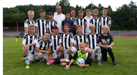
D- Junioren: SV Werl Aspe

Die beiden spannenden, sportlich ansprechenden und sehr fairen Endspiele hätten aus Sicht des Kinder- und Jugendfußballs mehr Zuschauer verdient gehabt. Organisatorisch war es für die Jugendabteilung des TuS Brake der (geglückte) Probelauf (unser „Con Fed Cup“) für den am 07.07. bis 09.07.2017 stattfindenden Schloss Cup.